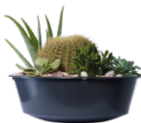
Planteringskruka medföljer vid de modeller där det anges.

Samtliga designtankar är tillverkade av UV-beständig PP-plast i mycket hög kvalitet. Tillverkningsprocessen ger varje tank ett unikt utseende. Ansluts enkelt till stupröret med Rapido stuprörsanslutning. Tanken är försedd med en mässingsgunga (3/4") och regnvattnet kan enkelt tappas genom medföljande tappkran.