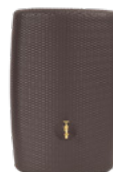
MOCCA 300 L

Regnvattenuppsamling. Ytskikt med finish i konstrotting-look.