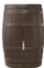
BARRICA 260 L

Regnvattenuppsamling. Rustikt träutseende, avtagbart lock.