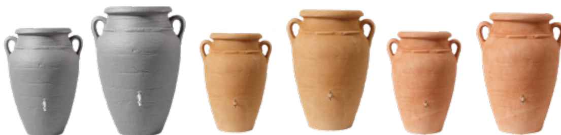
DARK GRANITE 250 L DARK GRANITE 360 L SANDSTONE 250 L SANDSTONE 360 L TERRACOTTA 250 L TERRACOTTA 360 L

Regnvattenuppsamling och planteringskruka.