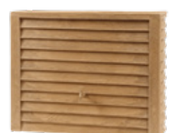
DARKWOOD 350 L