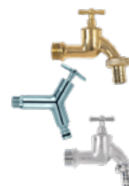
Tappkran med design beroende på designtank.