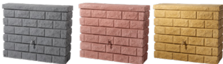
DARK GRANITE 400 L REDSTONE 400 L SANDSTONE 400 L

Regnvattenuppsamling med levande murstens-look.